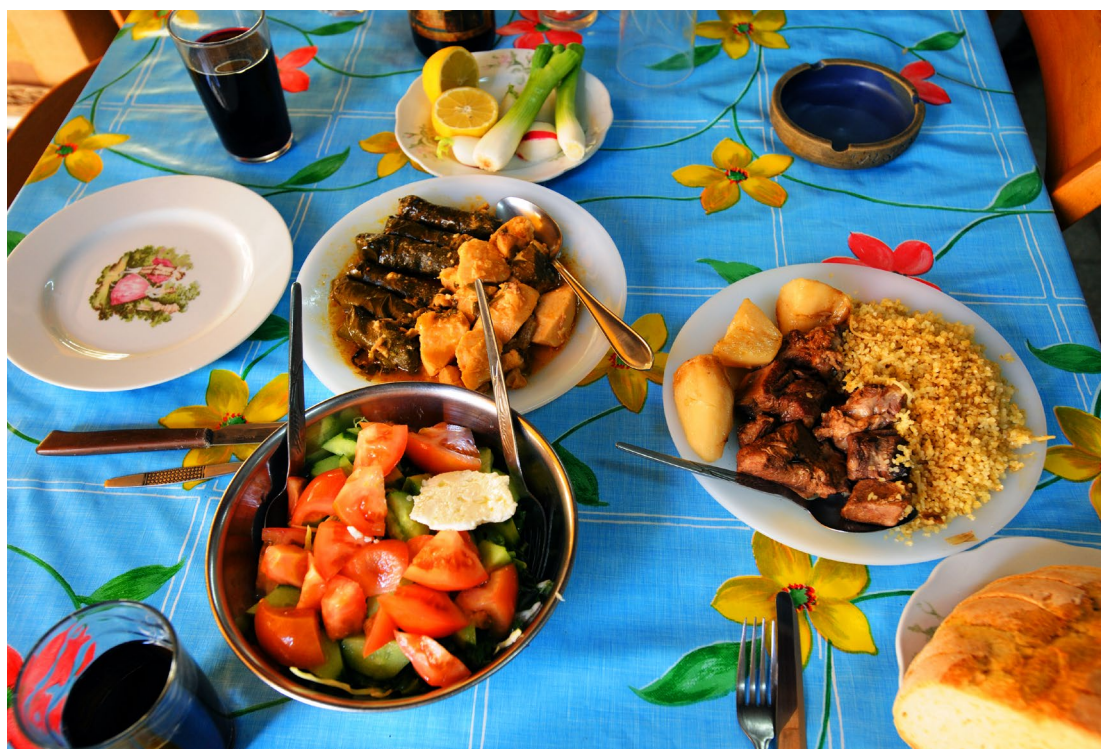
לשכת התיירות של קפריסין