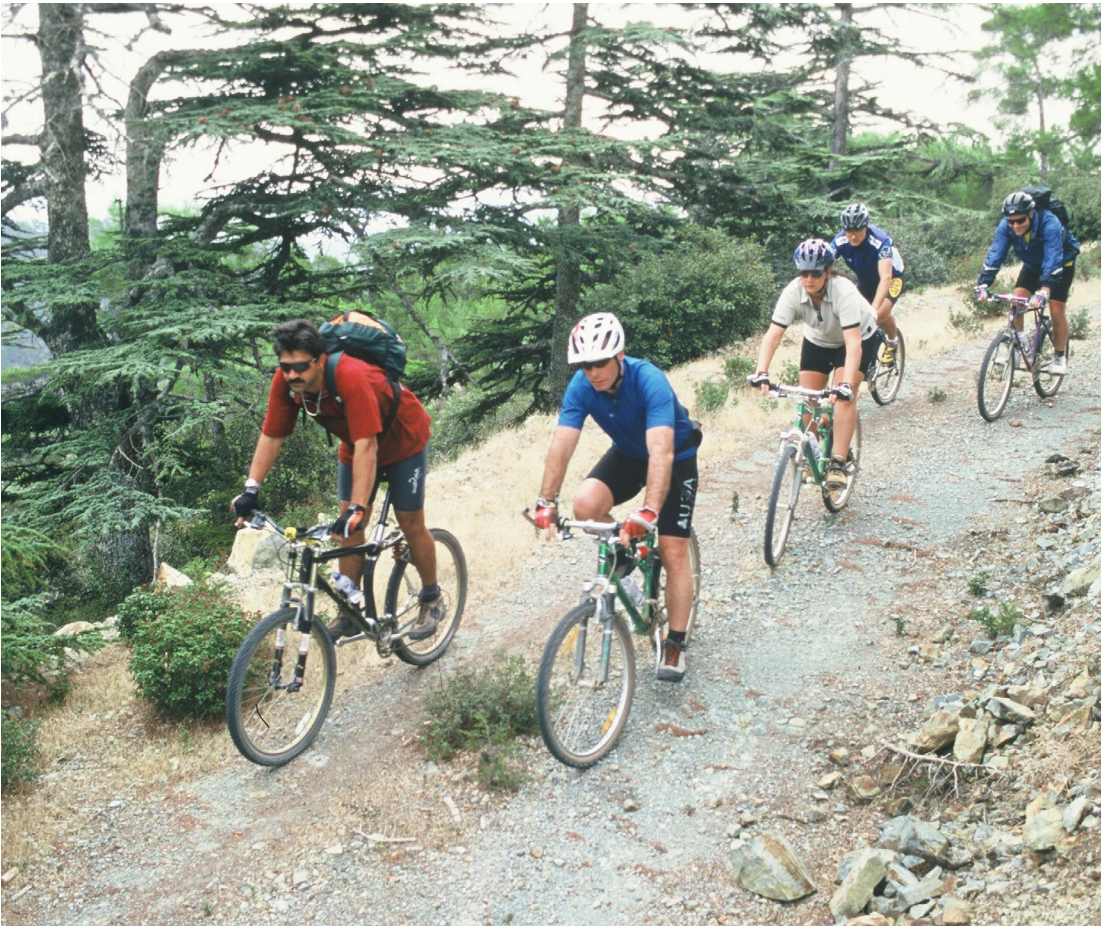
לשכת התיירות של קפריסין

קטנים עם בתי אבן עתיקים, כרמים ומטעי זיתים, אתרים ארכיאולוגים ועוד. הדרכים בקפריסין מאפשרות לרוכבים בכל הרמות ליהנות מהטיול – יש דרכים משניות סלולות שעוברות בין כפרים ולעומתם סינגלים ודרכי עפר שישמחו רוכבים מנוסים. ברחבי האי יש כמה מרכזי