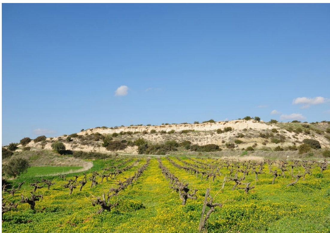
לשכת התיירות של קפריסין