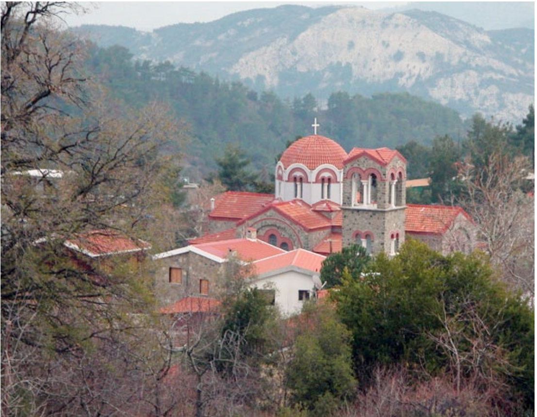
כנסייה באזור פלטרס