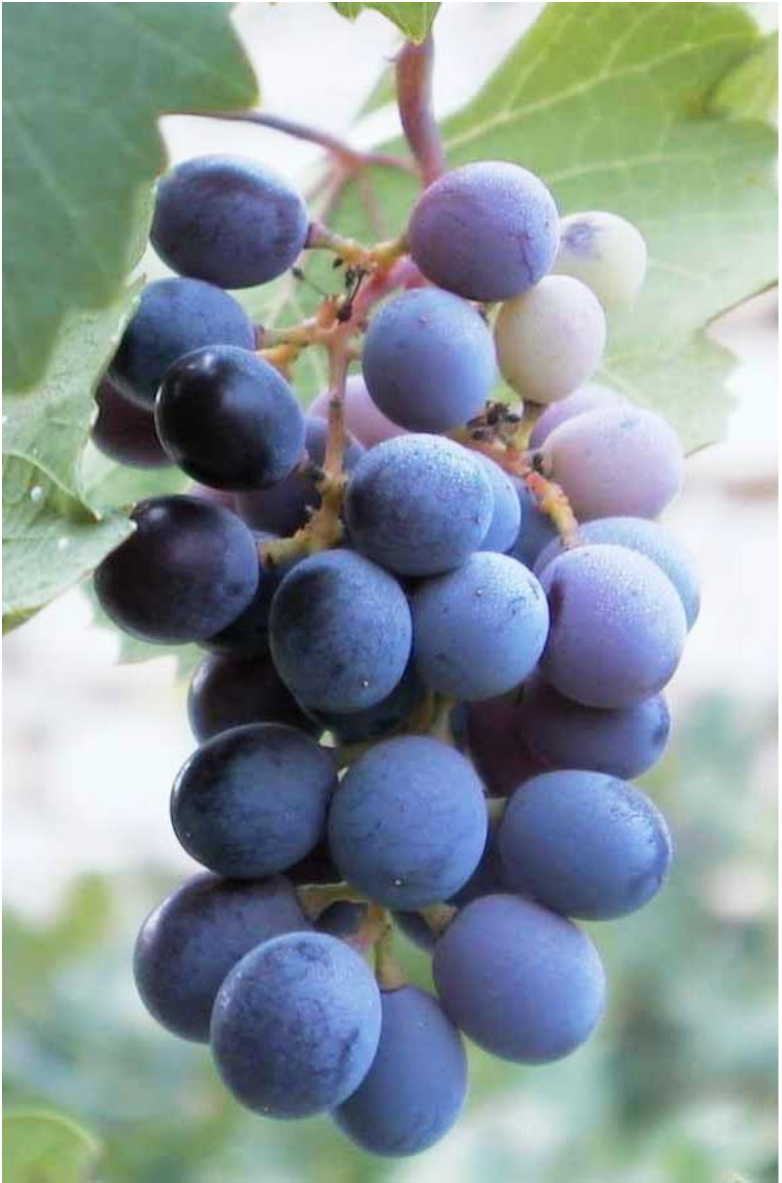
לשכת התיירות של קפריסין