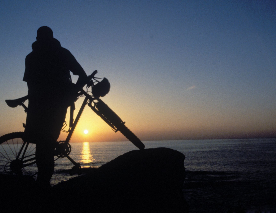
לשכת התיירות של קפריסין

אפרודיטה בחצי האי אקמאס, שם נהגה האלה לרחוץ ולטהר את גופה, משם אפשר להמשיך לסלע אפרודיטה, Petra tou Romiou, ממזרח לפאפוס – המקום בו היא הגיחה לאוויר העולם מתוך הים ואתר פופולרי לצילומי זוגות רומנטיים. היעד הבא בטיול הוא שרידי מקדש אפרודיטה ב־Kouklia, המקדש החשוב