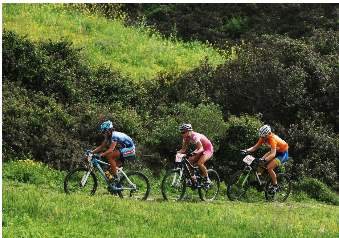
לשכת התיירות של קפריסין

זהו מסלול יפהפה, שעובר לאורכו של חצי האי אקמס (Akamas) במערב קפריסין ומציע נופים מפעימים של חצי האי ושל החופים והים. המסלול שלנו מתחיל בפוליס (Polis) ונמתחת לכיוון מערב, אל עבר לאקי (Lakki) ומרחצאות אפרודיטה. זמן קצר אחרי שעוברים את לאקי וממש לפני מרחצאות אפרודיטה הדרך פונה דרומה ומטפסת לעבר