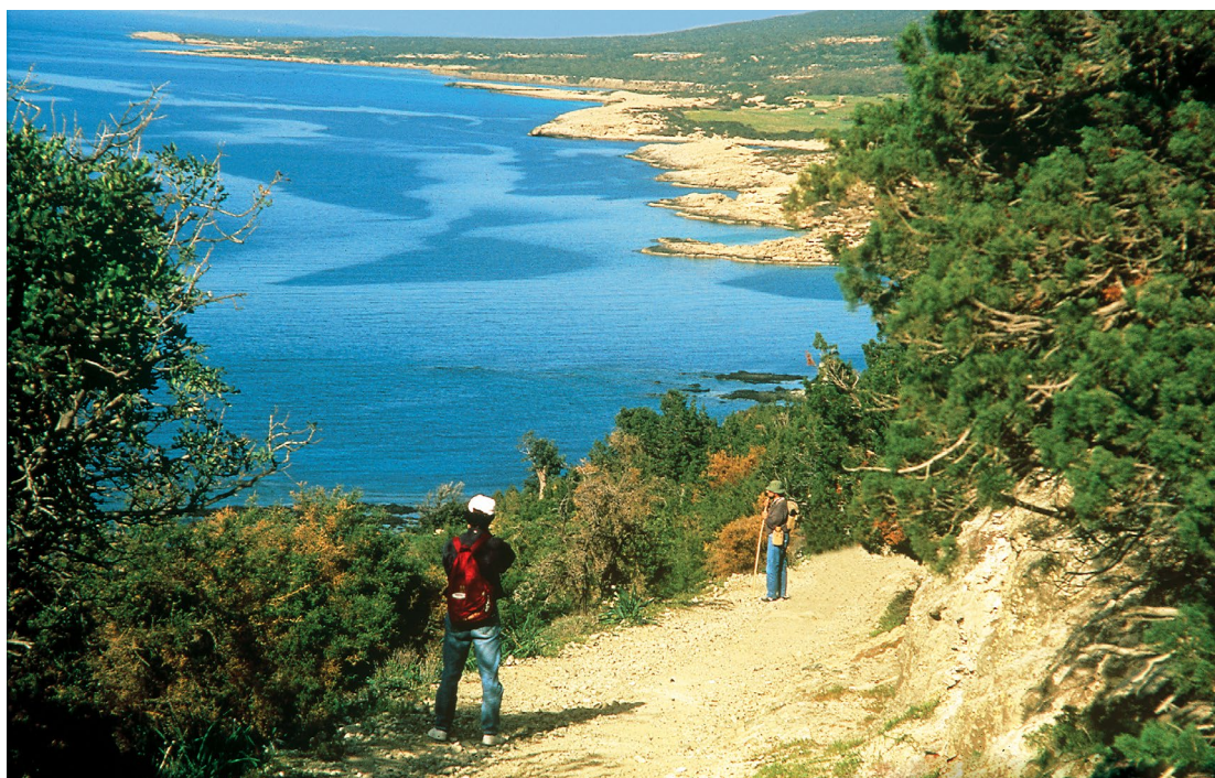
לשכת התיירות של קפריסין