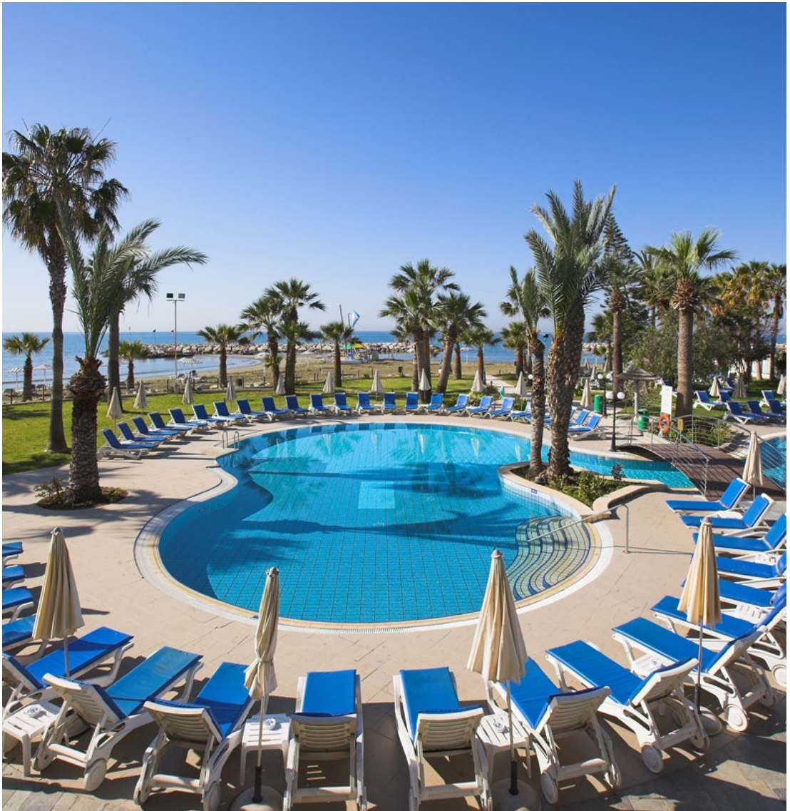
בריכה במלון גולדן ביי בלרנקה