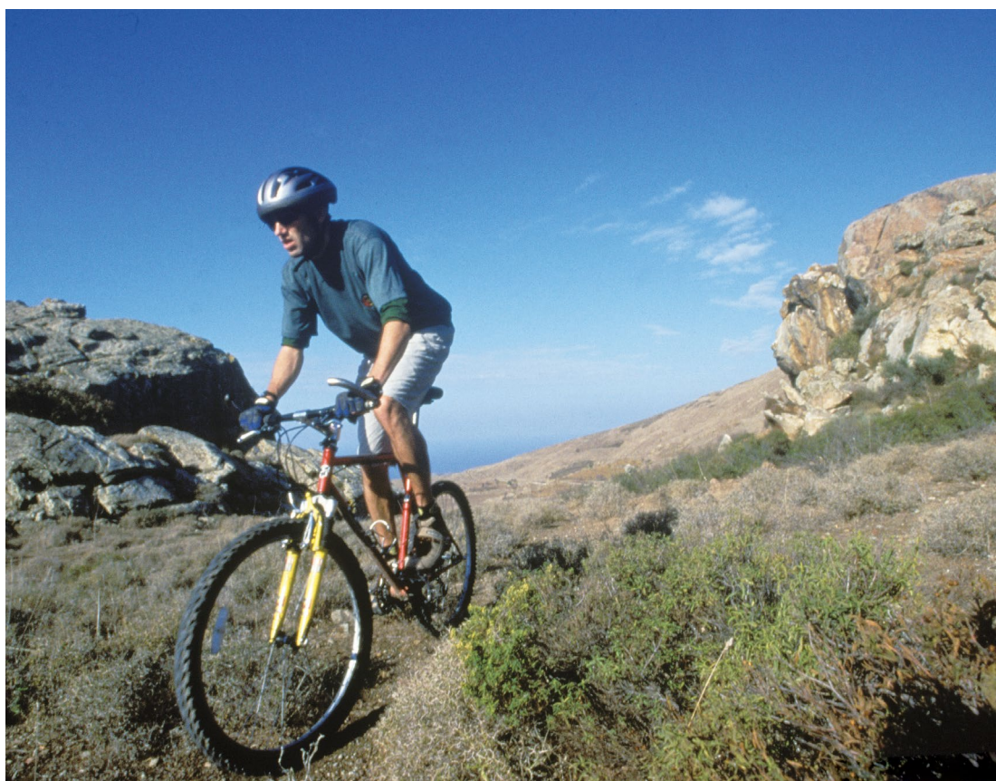
לשכת התיירות של קפריסין