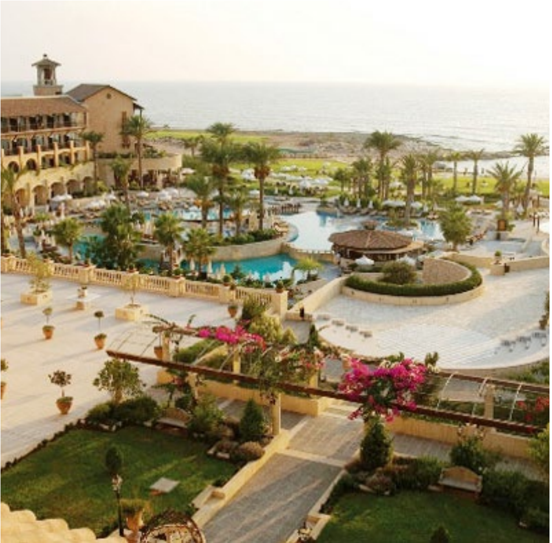
מלון אליסיום בפאפוס

יוקרתית. זהו מקום פופולרי לירח דבש בקרב זוגות בריטיים שבאים להתחתן בקפריסין. כתובת: Queen Verenikis Street, פאפוס אתר אינטרנט